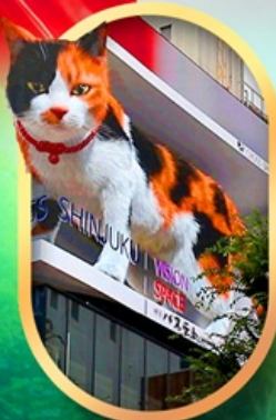
ช้อปปิ้งชินจุกุ