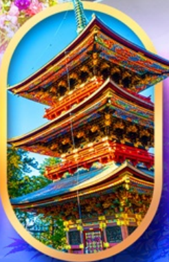
วัดนาริตะ-ซัน