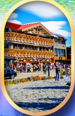
ภูเขาไฟฟูจิ ชั้น 5