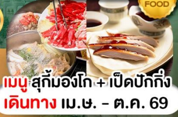
เมนูสุกั่มองโก + เปิดปักกิ่ง เดินทาง เม.ษ. - ต.ค. 69