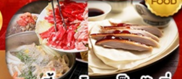
เมนู สุกี้มองโก + เปิดปักกิ่ง เดินทาง เม.ษ. - ต.ค. 69