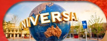
อิสระฟรีเดย์ 1 วัน หรือเลือกซื้อทัวร์เสริม US