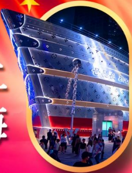
เรืออะทลัส