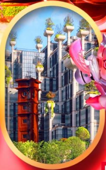
อาคารพินตันโบ