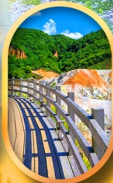
โนโบริเบ็ทสึ