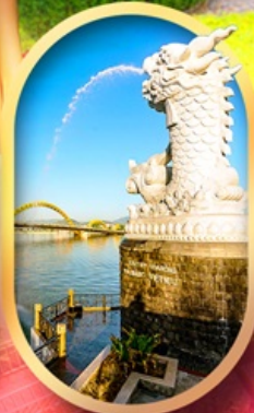
คาร์พดราท็อน