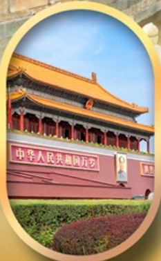
จัสมตรีสเทียนอันเหมิน