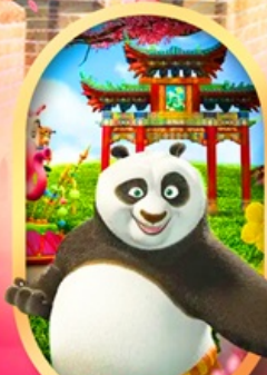
OPTION Universal Studios