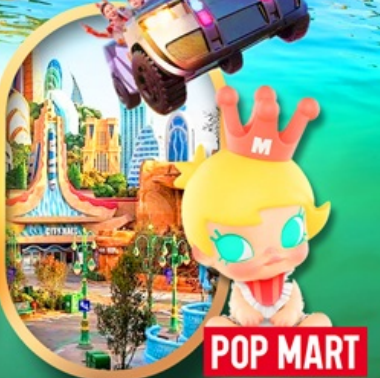
เลือกซื้อทัวร์เสริม เซี่ยงไฮ้ ดิสนีย์แลนด์