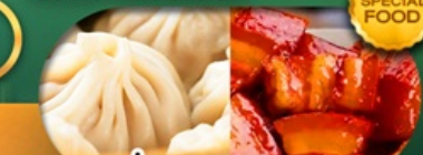
พิเศษ เสี่ยวหลงเปา หมูตงพอ เดินทาง ม.ค. - มิ.ย. 69