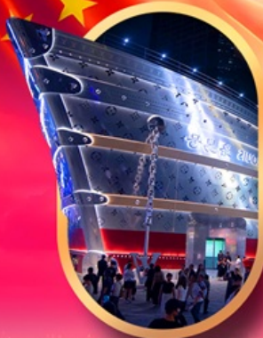
เรืออะหลุยส์