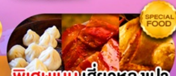
พิเศษเมนูเสี่ยวหลงเปา หมูตงพ้อ ไก่จอกาน เดินทาง ม.ค. - มี.ย. 69