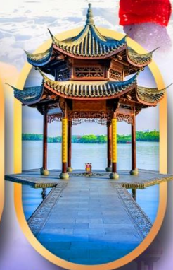
ล่องทะเลสาบซีหู