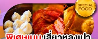
พิเศษเมนูเสี่ยวหลงเปา หมุดงพ้อ ไก่จอกาน เดินทาง ม.ค. - มี.ย. 69