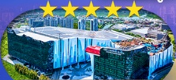
Crowne Plaza Snow World Hotel หรือเทียบเท่า S-ดิब् 5 ดาว 1 คืน

เซี่ยงไฮ้ ดิสนีย์แลนด์ ไอซ์แอนดส์โนวเวิลด์