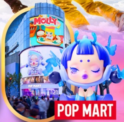
ถนนหนานจิง

เซี่ยงไฮ้ ดิสนีย์แลนด์ ไอซ์แอนดส์โนวเวิลด์