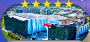
Crowne Plaza Snow World Hotel หรือเทียบเท่า ระดับ 5 ดาว 1 คืน

เชียงใหม่ ดิสนีย์แลนด์ ไอซ์แอนคส์โนวเวิลด์