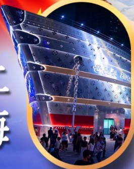
เรือคอะหลุยส์