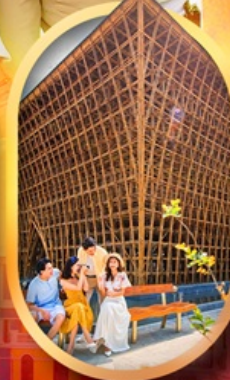
อาคารไม้ไผ่