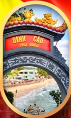
ศาลเจ้าติงเกา