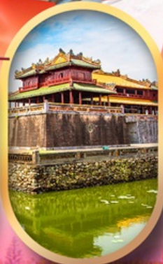
พระราชวังไคโน้ย