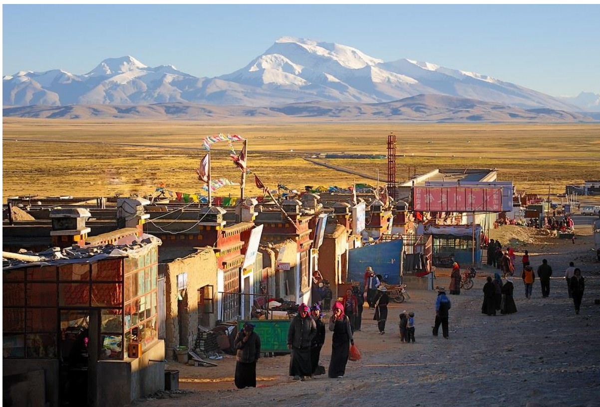
ที่พัก Dharchen Himalaya hotel