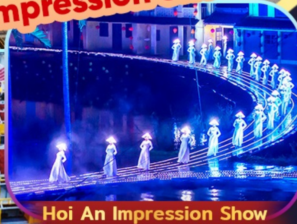
Hoi An Impression Show