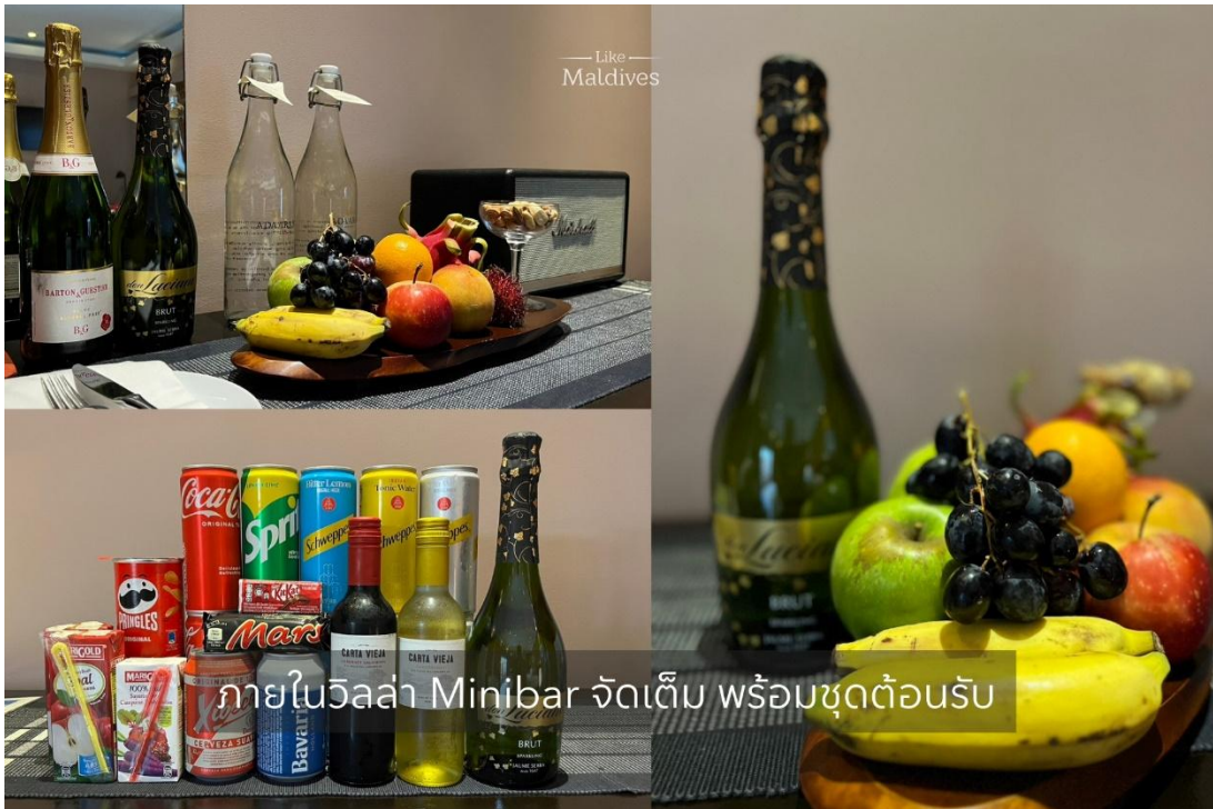
ภายในวิลล่า Minibar จัดเต็ม พร้อมชุดต้อนรับ