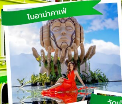
โอนาคาเฟ่