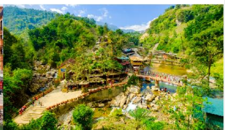
หมู่บ้านก๊อต ก๊อต

*ทางบริษัทฯ ขอสงวนสิทธิ์ในการสลับโปรแกรมทัวร์ตามความเหมาะสมขึ้นอยู่กับสถานการณ์หน้างาน โดยคำนึงถึงผลประโยชน์ของลูกค้าเป็นสำคัญ