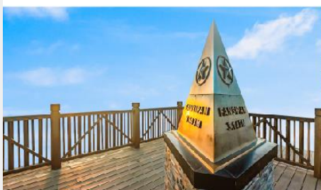
ยอดเขาฟานซิปัน