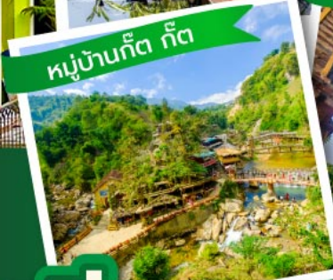
หมู่บ้านก๊อต ก๊อต