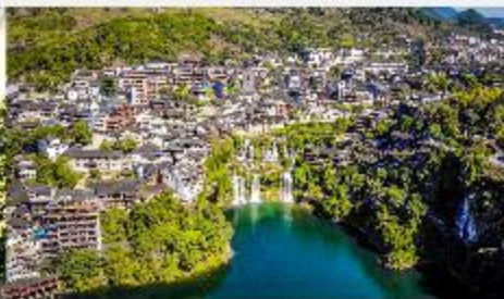
เมืองโบราณฝูหรงเจิน