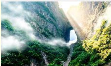
ประตูละคร