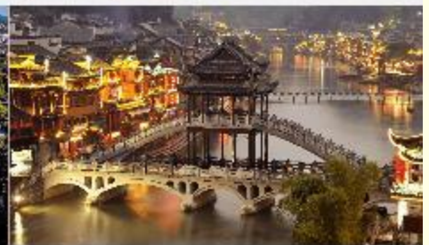
เมืองโบราณเฟิงหวง

*ทางบริษัทฯ ขอสงวนสิทธิ์ในการปรับเปลี่ยนโปรแกรมทัวร์ตามความเหมาะสมขึ้นอยู่กับสถานการณ์ปัจจุบัน โดยคำนึงถึงผลประโยชน์ของลูกค้าเป็นสำคัญ