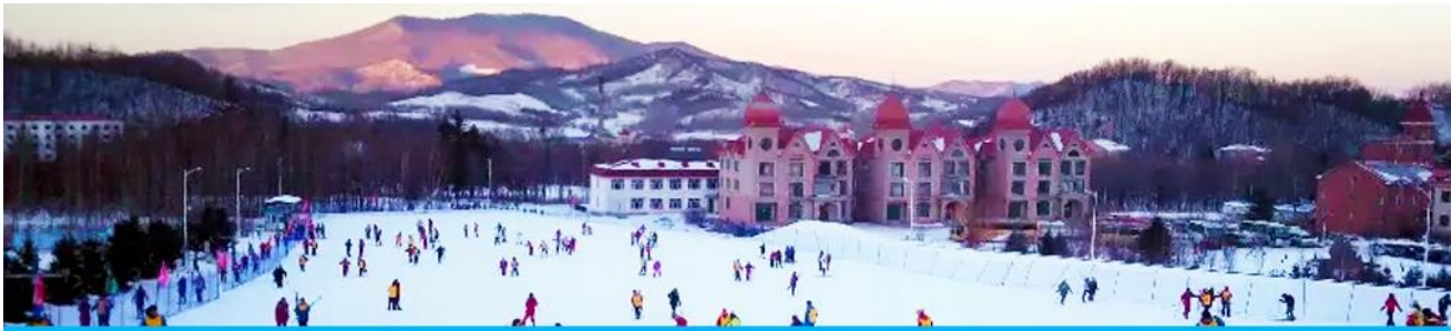
ลานสกียาบูลิ