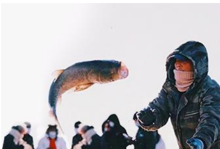
การจับปลาในฤดูหนาว

นำท่านชม การจับปลาในฤดูหนาว 冬捕 เป็นวิธีการจับปลาตามแม่น้ำและแหล่งน้ำในฤดูหนาวที่สืบทอดกันมายาวนาน โดยชาวบ้านจะนำแหดักปลามาวางดักไว้ตามจุดต่าง ๆ ก่อนที่ผิวน้ำจะปกคลุมด้วยน้ำแข็ง หลังจากผิวน้ำกลายเป็นน้ำแข็งแล้ว ชาวบ้านจะเจาะพื้นน้ำแข็งบริเวณที่มาแหวางดักอยู่เพื่อยกแหขึ้น จะมีปลาติดแหเป็นจำนวนมาก...พิเศษ ให้ท่านได้ชมการยกแหดักปลาจากสถานที่จริง และให้ท่านได้ชิมซุปรเนื้อปลาสด ๆ ที่ได้จากแหดักปลา