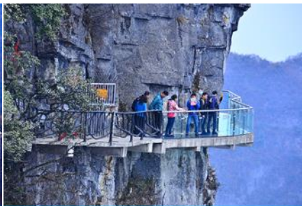
หน้าพลาวยี่ท้าวเดินกระจก