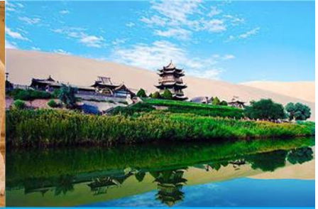
สระน้ำวังพระจันทร์