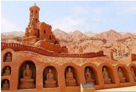
ถ้ำพระพันองค์

พักที่ HAMPTON BY HILTON HOTEL โรงแรมระดับ 4 ดาวหรือเทียบเท่าในเมืองกุหลู่ฟาน