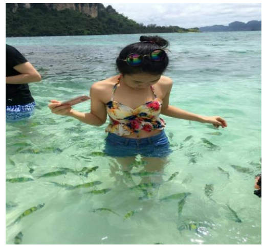
ชมทะเลแหวกUnseen in Thailand เชื่อมระหว่างเกาะทับ และเกาะหม้อ