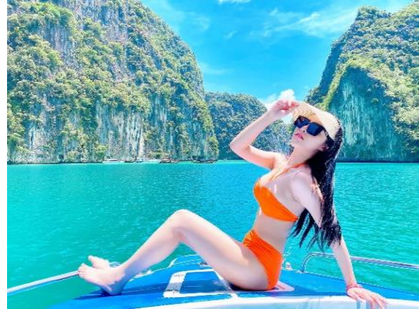
ลงเล่นน้ำดำสน็อคเกิล ชม ดอกไม้ทะเล และฝูงปลาการ์ตูน หน้า ถ้ำไวกิ้ง