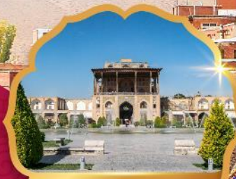
Ali Qapu Palace