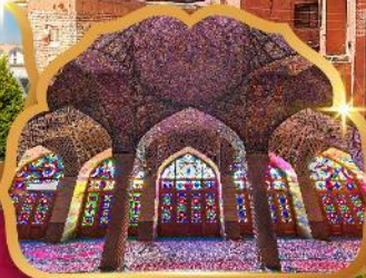
Nasir al Molk Mosque