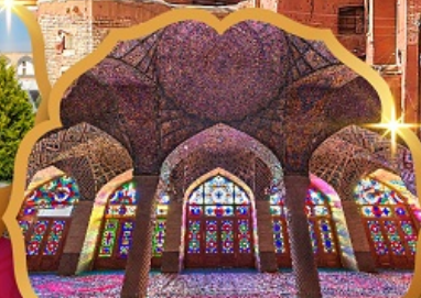
Nasir al Molk Mosque