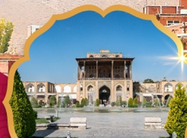
Ali Qapu Palace