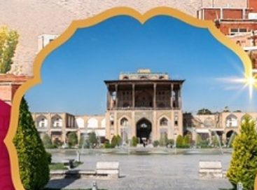
Ali Qapu Palace