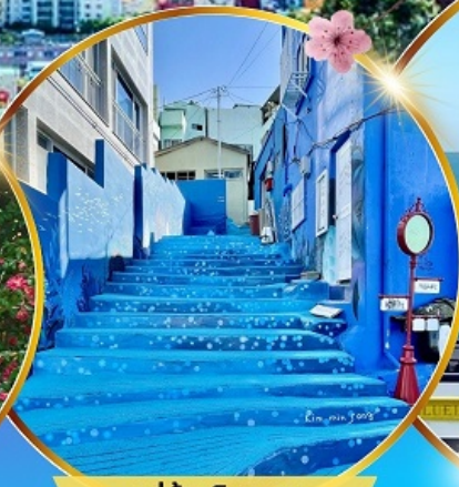
หมู่บ้านริมหทะเล