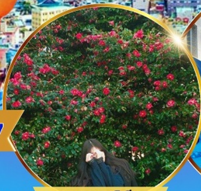
ชมดอกคามิเลีย