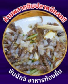
ห้ามพลาดอินปลาหมึกสด!!

ถ่ายรูปชิคๆ หมู่บ้านวัฒนธรรมคัมซอน เซคอิน คาเฟ่ริมทะเล วิวหลักล้าน ขึ้นเคเบิลคาร์ ชมทะเลปูซาน นั่งรถไฟปุกปิก sky capsule ห้ามพลาด!! ตลาดปลาที่ใหญ่ที่สุด ชิมของอร่อยที่ตลาดแฮอนแด อิสระช้อปปิ้ง Lotte Duty Free