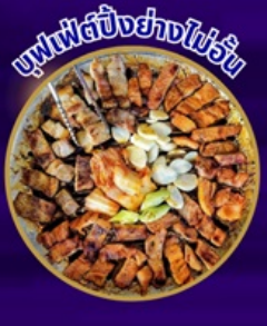
ซูฟเฟอิตปูย่างไข่นม