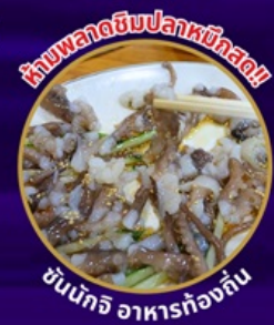
ห้ามพลาดอินปลาหมึกสด!!

ถ่ายรูปชิคๆ หมู่บ้านวัฒนธรรมคัมซอน เชคอิน คาเฟ่ริมทะเล วิวหลักล้าน ขึ้นเคเบิลคาร์ ชมทะเลปูซาน นั่งรถไฟปิ๊กปิ๊ก sky capsule ห้ามพลาด!! ตลาดปลาที่ใหญ่ที่สุด ชิมของอร่อยที่ตลาดแฮอนแด อิสระช้อปปิ้ง Lotte Duty Free