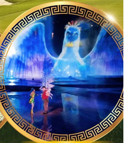
การแสดงม่านน้ำ