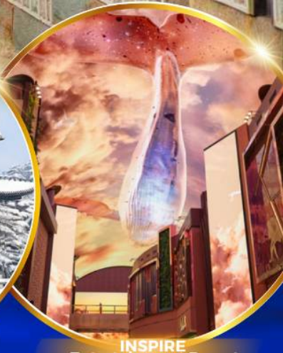
INSPIRE Entertainment Resort

ชมจอ LED ขนาดยักษ์ที่รีสอร์ท 5 ดาว ใหญ่ที่สุดในเอเชียเหนือ ชมพระราชวังคยองบกคุง ย้อนอดีตหมู่บ้านบุคซอน อันอก ใส่ชุดฮันบก ทำข้าวห่อสาหร่าย อิสระช้อปปิ้ง Lotte Duty Free