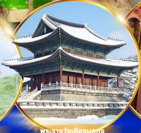
พระราชวังเคียงบกคุง