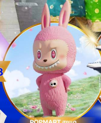
POP MART ฮงแด