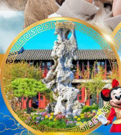
สวนหลิวหยวน