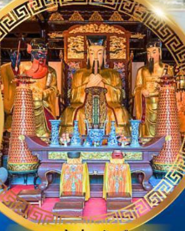
ศาลเจ้าพ่อหลักเมือง