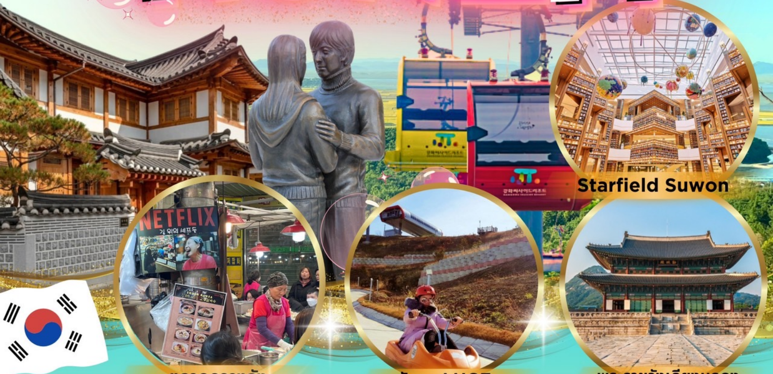
ตลาดกวางจง