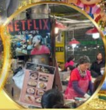
สตรีทฟู้ดตลาดกวางจิ่ง