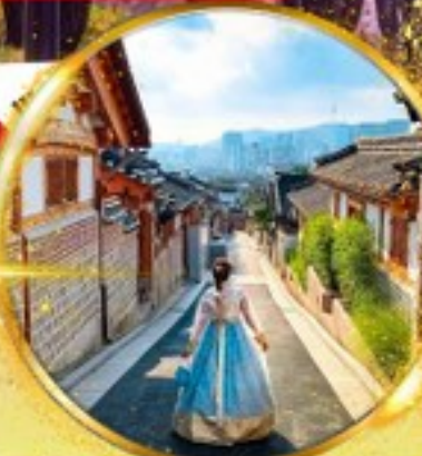
หมู่บ้านโบราณบุกซอน