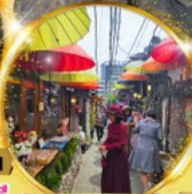
อิกซอนดง