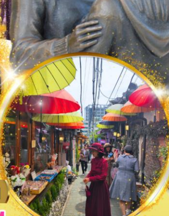
อิกซอนดง