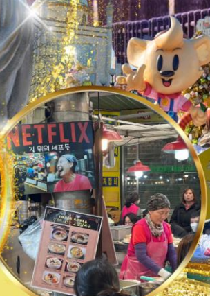
สตรีทฟู้ดตลาดกวางจิ่ง