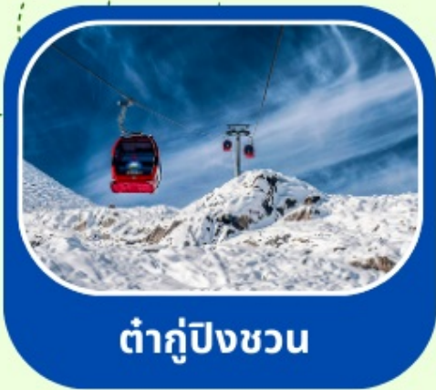
ต่ากู๋ปิงชวน