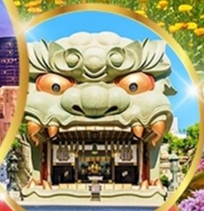
ศาลเจ้าอิมบะ ยาชากะ