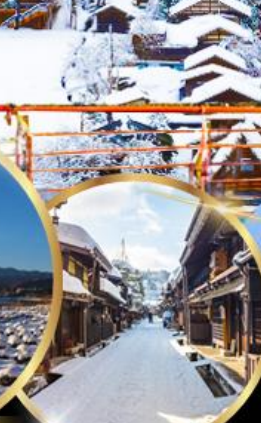
ทาคายาม่า