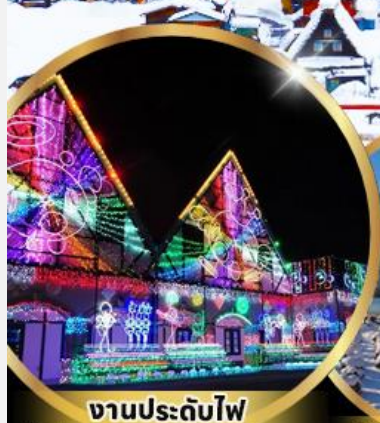
งานประดับไฟ Tokyo german village