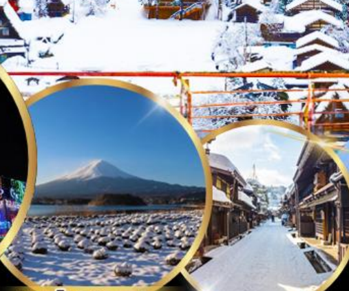
สวนโออิชิ พาร์ค