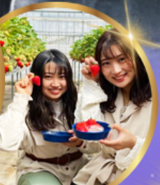
บุฟเฟต์ สดอเบอร์รี่ เก็บสดจากต้น

45,919 ราคา เที่ยว รวมภาษีมูลค่าเพิ่ม 7%