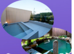
พิก ออนเซ็น 2 ถิ่น