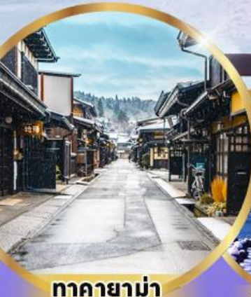
ทาคายาม่า