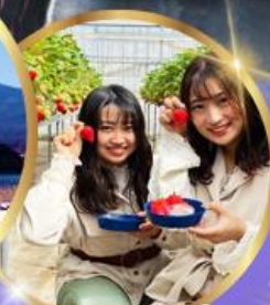
บุฟเฟต์ สดอเบอร์รี่ เก็บสดจากต้น

45,919 ราคา เดียว บาท รวมภาษีมูลค่าเพิ่ม 7%