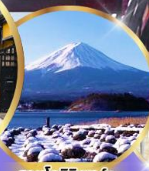
สวนโออิชิ พาร์ค