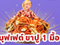
บุฟเฟต์ ซาปู 1 มือ

45,919 ราคา เที่ยว รวมภาษีมูลค่าเพิ่ม 7%