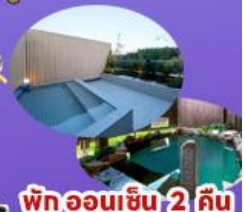
พักออนเซ็น 2 คืน