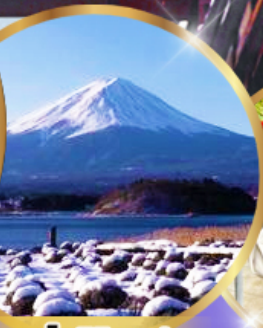
สวนโออิชิ พาร์ค