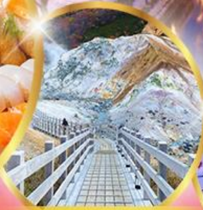
หุบเขานรกจิทอกุตามิ