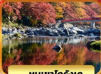
หุบเขาโคริงเค