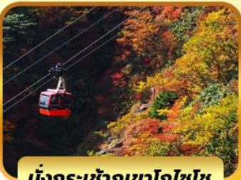
นั่งกระเช้าภูเขาโทโฮโซ