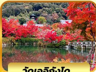
วัดเออิทังโด