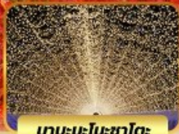
น้ำตกมิกะโตะ