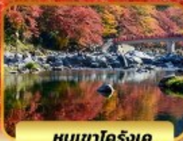
หุบเขาโคริงเค