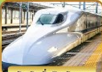
สัมฟัสนึงซึบกันเซน