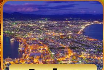
ชมวิวดาโกดาเตะ