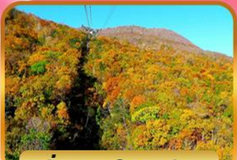
นั่งกระเช้าอุซุซัง