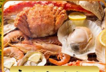
ปิ้งย่างร้านดังมันดะ