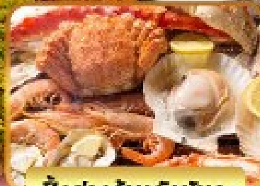
บิงย่างร้านดังเน้นตะ