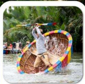
"ล่องเรือกระดิง"

นั่งกระเช้าที่ยาวที่สุดในโลก ขึ้นสู่บาน่าฮิลล์ • หมู่บ้านฝรั่งเศส • สวนสนุก FANTASY PARK LE JARDIN D'AMOUR • สะพานมือสีทอง • วัดหลินจิ้ง • เมืองโบราณฮอยอัน หมู่บ้านกิมถาน • ล่องเรือกระดิง • สะพานมังกร • APEC PARK • ตลาดฮาน