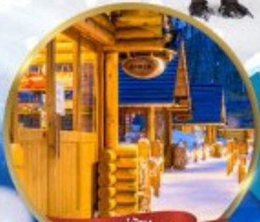
หมู่บ้าน NINGLE TERRACE

สนุกสนาน ณ ลานสกี • หมู่บ้านราเมนอาซาฮิคาว่า • หมู่บ้านนิงเกิลเทอเรส ขบวนพาเหรดเพนกวิน ณ สวนสัตว์อาซาฮิคาว่า • โรงงานช็อกโกแลต โอดารุ • ศาลเจ้าฮอกไกโด • พระใหญ่ HILL OF BUDDHA