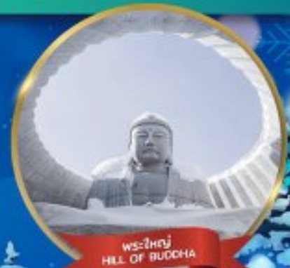
พระใหญ่ HILL OF BUDDHA