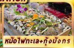
หม้อไฟทะเล+กุ้งมังกร