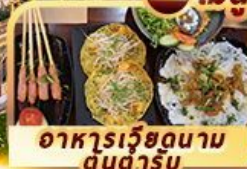
อาหารเวียดนาม ดนตรี