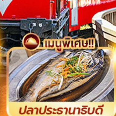
เมนูพิเศษ!! ปลาประดานาธิบดี