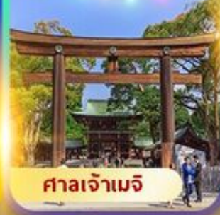
ศาลเจ้าเมจิ