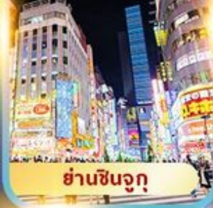
ย่านชินจูกุ