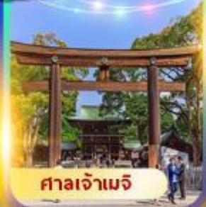
ศาลเจ้าเมจิ