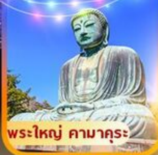
พระใหญ่ คามาคุระ