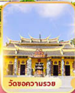
วัดขอความรวย