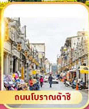
ถนนโบราณต้าซี