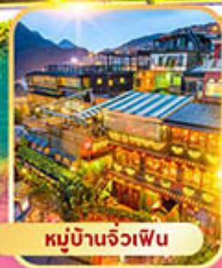
หมู่บ้านจิวเฟิน