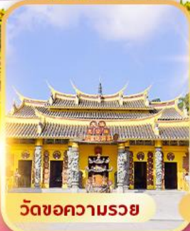
วัดขอความรอย