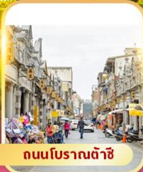
ถนนโบราณต้าชี่