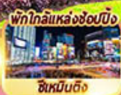
พักใกล้แหล่งช้อปปิ้ง