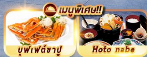
บุฟเฟ่ต์ซาบู