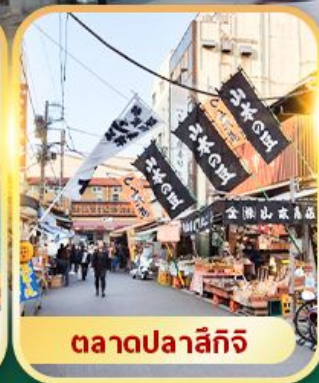
ตลาดปลาชิกิ