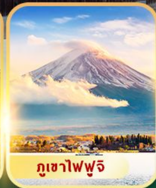
ภูเขาไฟฟูจิ