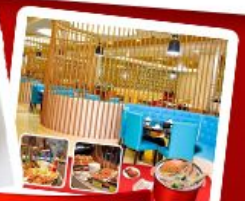
กุ้งแม่น้ำ + HOTPOT SEAFOOD